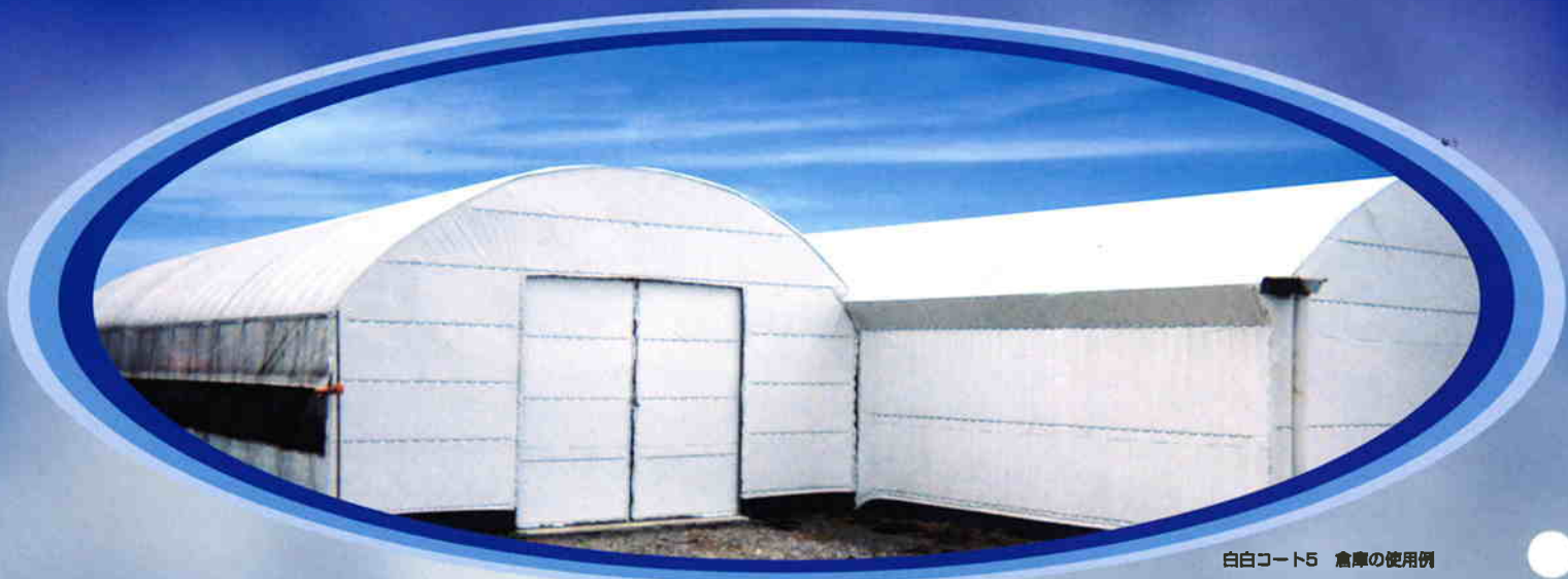
白白コート5 倉庫の使用例