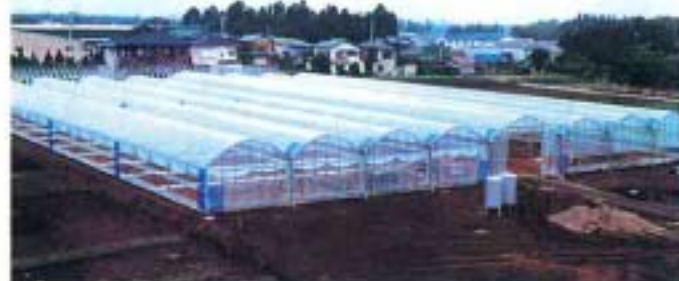
千葉市(市)チャイルドフラワー